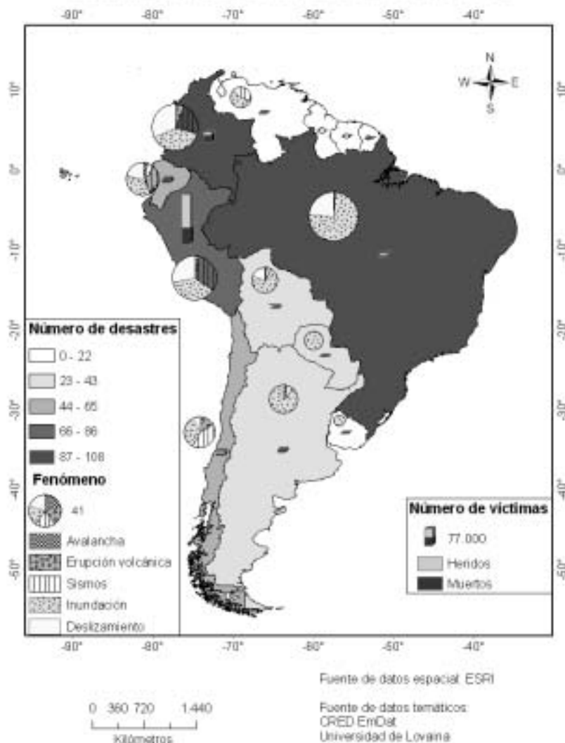
Figura 2a. Ocurrencia de desastres naturales, por tipos, en Sudamérica, entre 1947 – 1998. Elaboración propia a partir de EM_DAT.