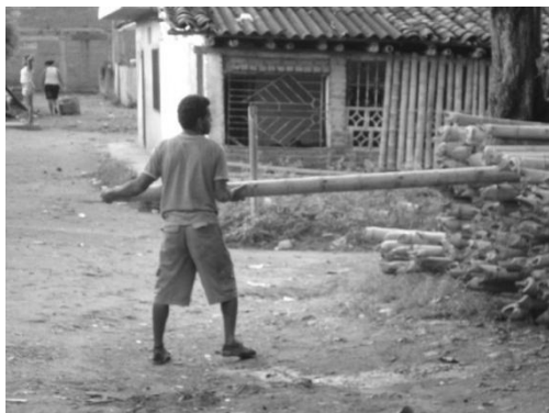
Foto 3 Hombre descargando guadua

forma en que son distribuidas y cómo la comunidad se relaciona con los recursos naturales y materiales. La manera en cómo la gente se ubica en torno a los elementos naturales y materiales del espacio local, enmarca los significados que estos recursos contienen para la vida cotidiana de la comunidad dentro de su distribución, reproducción, mantenimiento y consumo propio o para la venta. (Véase fotos 3 y 4)