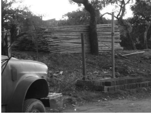
Foto 4. A copio de guadua en el sector Playa Renaciente.