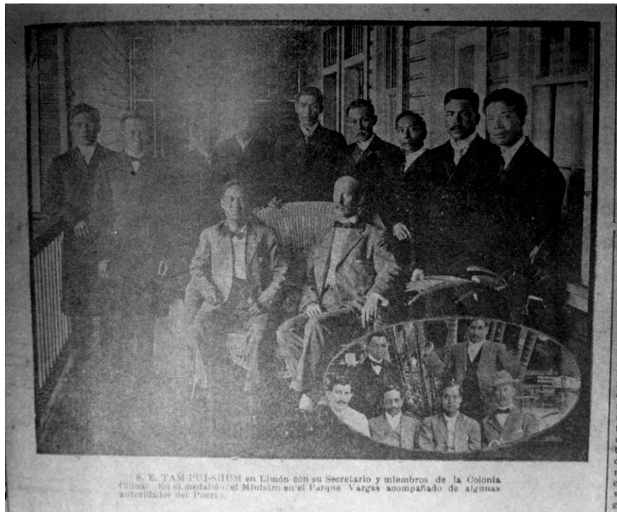
Fig. N° 7. Tam Pui Shum con miembros de la colonia china en Limón

evidenciaron su progreso económico. Con la intención de hospedarlo en los mejores sitios, en enero de 1911, ya en Limón se habían recolectado dos mil colones ( El Noticiero , 1911, 28 de enero, p.3). El banquete con el cuerpo consular y diplomático que ofreció la colonia china incluyó 50 cubiertos y 6 músicos ( El Noticiero , 1911, 06 de junio, p. 3) y en Puntarenas donde se le ofreció una recepción en el Club Waison, Tai Pui Shum fue hospedado en el Hotel Europa y los agasajos incluyeron juegos pirotécnicos valorados en cinco mil colones ( El Noticiero , 1911, 19 de mayo, p.2). Algunos consideraban que la acogida había sido exagerada: “la llegada de la nobleza amarilla, de tal manera que ni cuando llegó el respetabilísimo Delegado de su Santidad, hubo aquí tales muestra (sic) de regocijo y entusiasmo” (Rodríguez, 2000, 201).