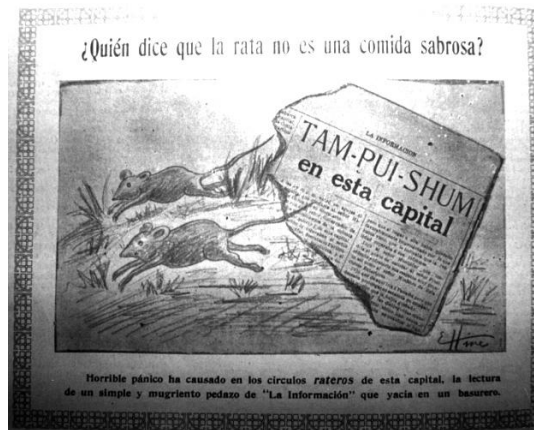
Fig. N° 1. Ante la visita de un representante chino a San José, una revista presentaba estas imágenes. El Cometa . II. N° 45. 27/5/1911, p. 2.