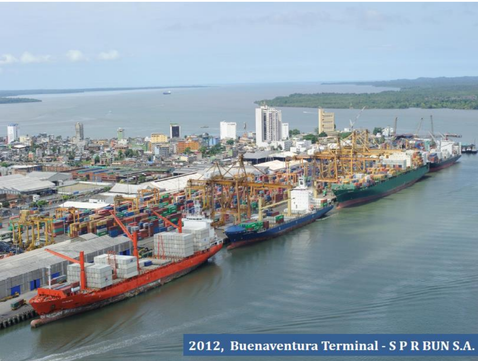
Gráfico 1. XXI Congreso Latinoamericano de Puertos 2012

2012, Buenaventura Terminal - S P R BUN S.A.