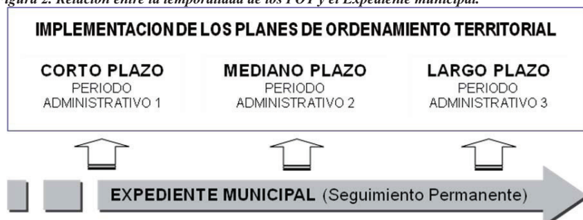
Figura 2. Relación entre la temporalidad de los POT y el Expediente municipal.