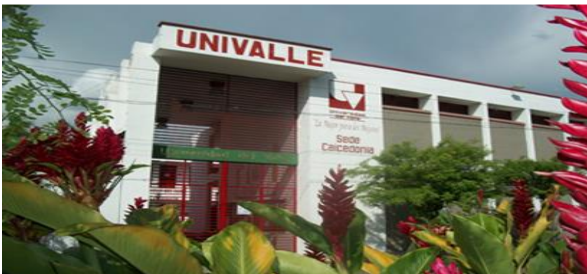
Ilustración 1. Universidad del Valle sede Caicedonia, Entrada principal.