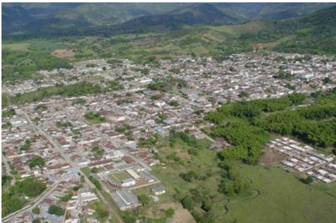
Ilustración 2. Vista panorámica de Caicedonia.