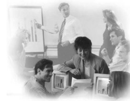
Figura 2. Escenario de la Educación Tradicional

El avance tecnológico en comunicaciones móviles permite hoy día, dotar a los equipos móviles con interfaces de comunicación integradas que permiten la configuración y acceso a redes locales o globales (Internet), esto supone el acceso a redes de manera independiente a un lugar en específico ampliando el uso de los dispositivos a un campo de mayor auge.