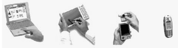
Figura 3. Dispositivos Computacionales Móviles

Para Trifonova [4] el M-Learning es considerado como el aprendizaje a través de dispositivos computacionales móviles (Pocket Pc's, PDA's, etc.). Ampliando el concepto de dispositivos móviles (ver figura 3) a los de pequeña envergadura, autónomos y discretos que formen parte de la vida cotidiana y puedan ser utilizados para el proceso de aprendizaje. La arquitectura requiere del soporte de protocolos de comunicación que afiance el flujo entre el repositorio de la información y el equipo utilizado por el usuario final.