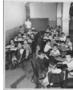
Figura 1. Escenario de la Educación Tradicional

La Figura 1, muestra un escenario tipo de la educación tradicional en la cual se conjugan los elementos conocidos por todos: libros, materias, cuadernos, pizarra, alumnos, profesor, escuela.