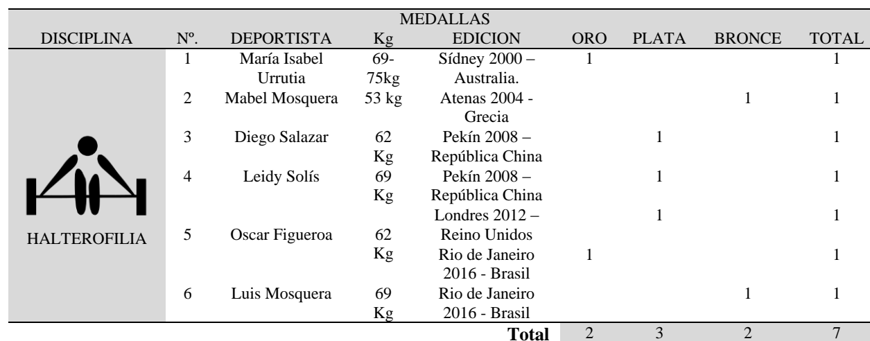
Tabla 3. Medallero Olímpico Disciplina Halterofilia (Colombia).