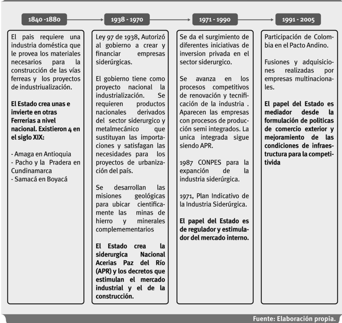
Cuadro 1. El papel del Estado y su relación con la evolución del sector siderúrgico en Colombia

Con relación al cuadro se observa que la intervención del Estado en la evolución del sector inició dentro del pilar regulatorio, y que ha venido avanzando a un esquema más normativo, pero que aún no se llega a un nivel cognitivo dadas las presiones competitivas del entorno que han llevado a una respuesta estratégica menos pasiva o dependiente y más competitiva, caracterizada por las fusiones y adquisiciones o alianzas con capitales extranjeros.