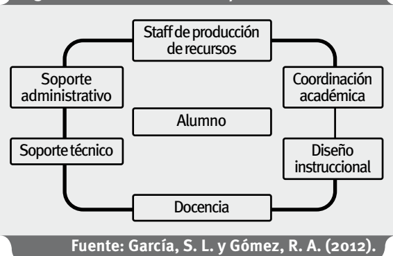
Figura 2. Selección de áreas primarias en la EV