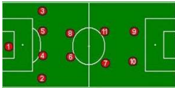
Ilustración 8. Variante táctica 1-4-2-2-2

Fuente: http://www.futbolgol.es/futbol-gol/sistemas-de-juego-capitulo-i-4-4-2.html .