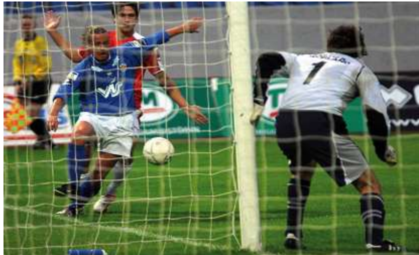
Ilustración 2. Fases ofensivas y defensivas del juego