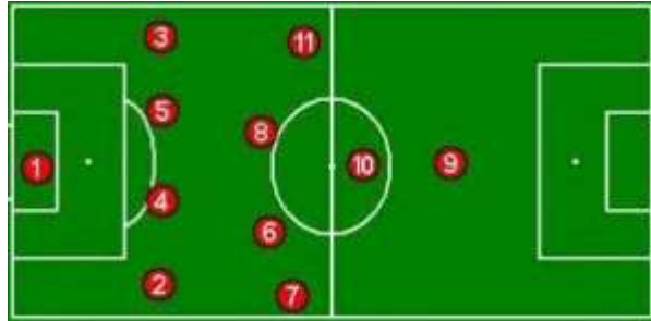
Ilustración 6. Variante táctica 1-4-4-1-1

Fuente: http://www.futbolgol.es/futbol-gol/sistemas-de-juego-capitulo-i-4-4-2.html .