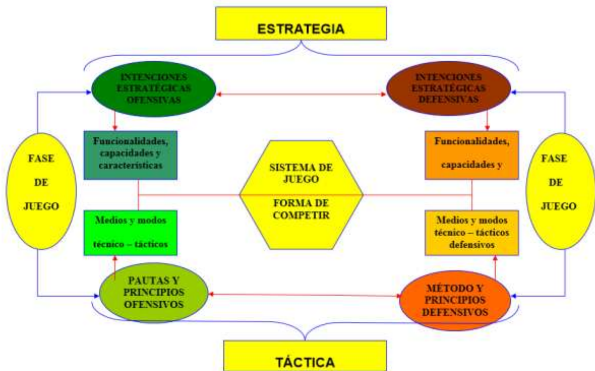
Figura 3. Red Sistémica de relación y distribución de los futbolistas en el terreno de juego