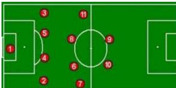
Ilustración 5. Variante táctica 1-4-4-2