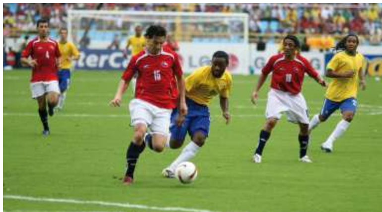
Ilustración 4. Cobertura defensiva