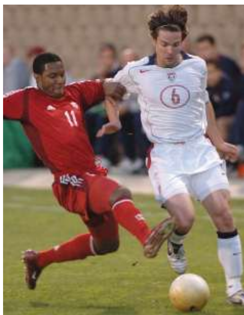
Ilustración 1. Situaciones de oposición