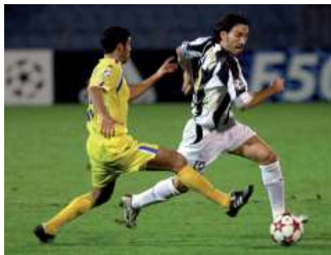
Ilustración 3. Acción de desmarque