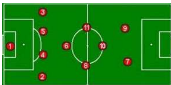
Ilustración 7. Variante táctica 1-4-4-2 (rombo)