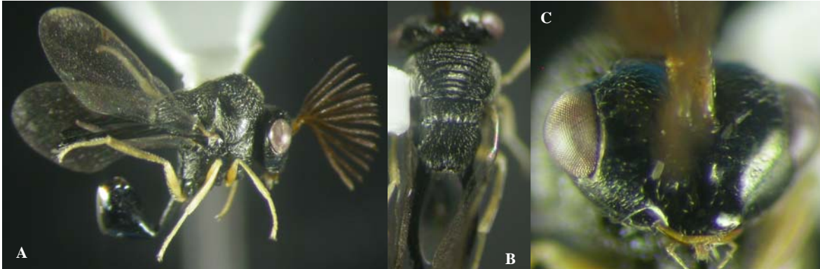
Figura 1. Kapala iridicolor (macho): A, vista lateral; B, vista dorsal del mesonotum; C, vista frontal de cabeza.