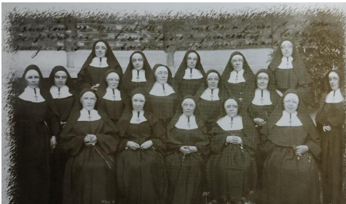
Figura 1. Hermanas de la Congregación de la Providencia y la Inmaculada Concepción, fundadoras en Bélgica. Libro de oro, Congregación de las Hermanas de la Providencia y la Inmaculada Concepción, 100 años haciendo cultura por Cali (2007)

Revolución, y muy pocos habían logrado reorganizarse, por ello, las primeras Hermanas de la Providencia que se establecieron en Bélgica, lo hicieron en 1822 en Dhuy y en Branchon, también llegaron a Jambes, y finalmente a Champions en 1830 donde la Congregación estableció su casa matriz hasta la actualidad. 212