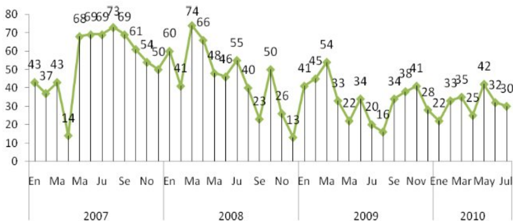
Gráfico 1. Total casos de fleteo en cali periodo 2007 – 2010